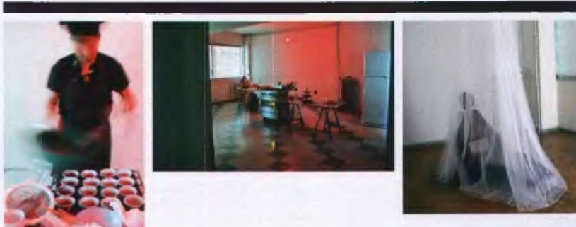
Μην τη χάσετε **** Καλή *** Ενδιαφέρουσα ** Αδιάφορα * Κακή □ Στην περίπτωση ομαδικών ή αναδρομικών εκθέσεων η αξιολόγηση αφορά την επιμέλεια της έκθεσης και όχι το έργο αυτό καθαυτό.

Outlet, Ιάσωνος 42, Μεταξουργείο, 2105232222