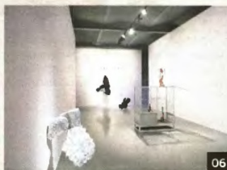
01. 02. 03. Fondazione Pastificio Cerere, Roma, 2011. 04. Johannes Wohnseifer 05. Ann Craven, from the installation «Shadow's Moon». 06. Mehdi Chouakri, Berlin 2011.