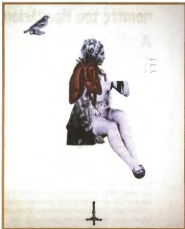
Η Augusta Atla στα κολλάζ της συνδυάζει ποικίλα στοιχεία, από εικόνες περιοδικών μέχρι παραδοσιακά ελληνικές φορεσιές