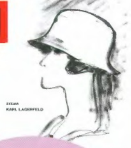
ΣΧΗΜΑ KARL LAGERFELD ΣΤΙΛΟΣ ΑΥΡΑ