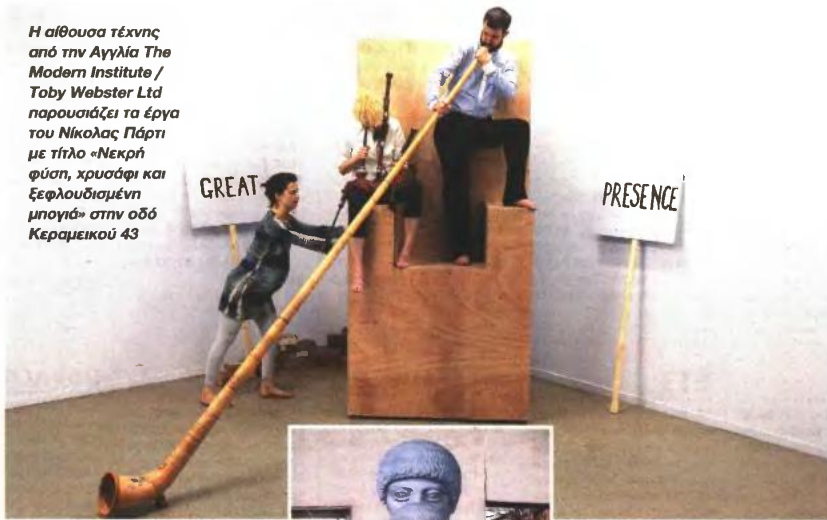
Η αίθουσα τέχνης από την Αγγλία The Modern Institute / Toby Webster Ltd παρουσιάζει τα έργα του Νικόλας Πάρτι με τίτλο «Νεκρή φύση, χρυσάφι και ξεφλουδιαμένη μοσχί» στην οδό Κεραμεικού 43