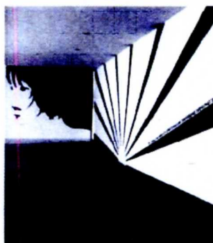
1. RICHARD WOODS@«LATE NIGHT FICTION» 2. ΡΕΒΕΚΚΑ ΚΑΜΧΗ, C. WOODS@REMAP 3. ΙΛΕΑΝΑ ΤΟΥΝΤΑ, Δ. ΑΝΤΩΝΙΤΣΗΣ - T. SCHULZ@REMAP