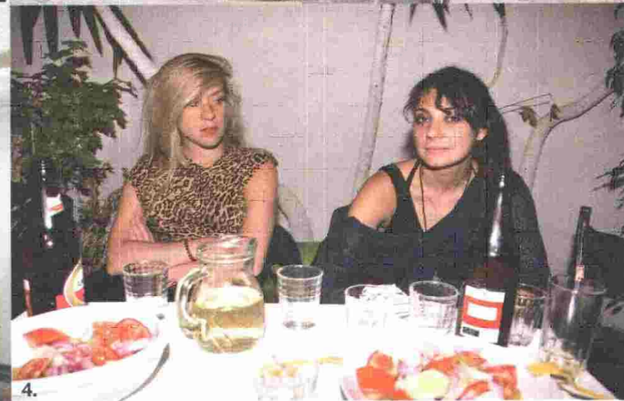
1. Πάρτι στην Ιάσονος 47, 2. Πρότζεκτ ποδηλατοδρομίας, 3. Έργο του Σου-Μέι Τσε στην ΑΔ, 4. Τα σελέμπριτι: Κλόε Σεβινί και Λίζι Μπουγάτσος.