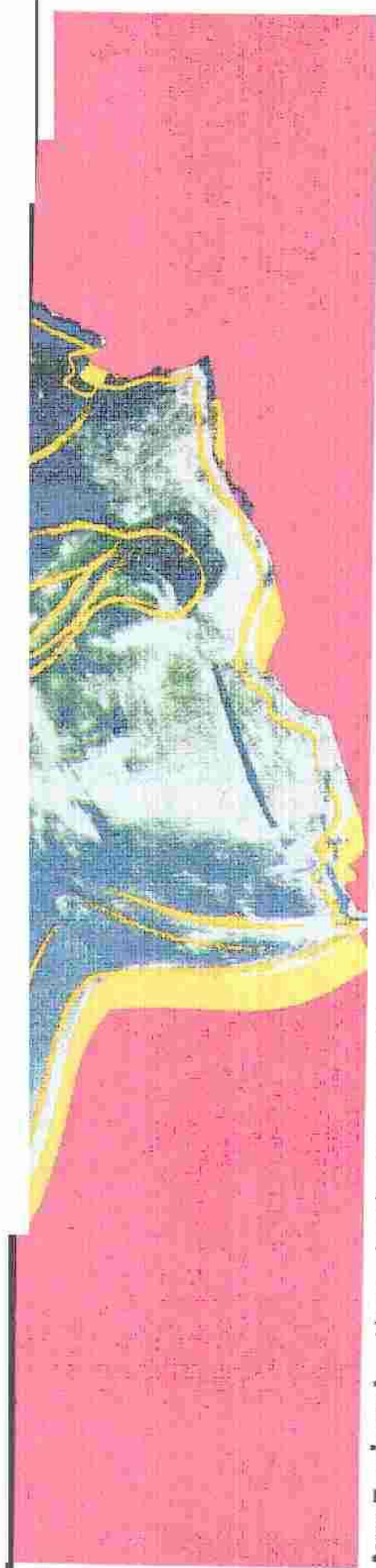
Αντι Γουόρχολ, «Alexander the Great», 1982.

Τα πορτρέτα των διασημοτήτων του Αντι Γουόρχολ είναι ίσως και τα πιο γνωστά του έργα. Ποιος δεν θυμάται τις διαφορετικές Μέρλιν με τα έντονα χρώματα ή τις αντίστοιχες Λιζ Τέιλορ; Στις 6 Οκτωβρίου, κάποιες από τις σημαντικότερες προσωπογραφίες του βασιλιά της ποπ art συγκεντρώνονται στην Αθήνα, σε μια έκθεση με τίτλο «Wathol/Icon: Η δημιουργία της εικόνας». Η παρουσίαση αυτών των πορτρέτων που δημιούργησε ο Γουόρχολ καθάρισε μια καιρία κριτική της σύγχρονης εμμονής με τη φήμη, γίνεται με φόντο μια σημαντική συλλογή Βυζαντινής αγιογραφίας. Με αυτό τον τρόπο, και σύμφωνα με τους διοργανωτές, η έκθεση διερευνά την έννοια της ει-