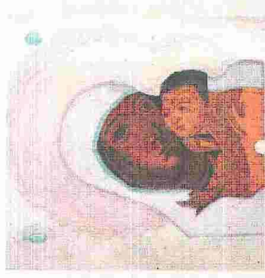
Έργο του Σπύρου Παπαλουκά.

Δεν είναι βέβαια μόνο αυτές οι εκθέσεις που θα απασχολήσουν φέτος το φθινόπωρο το αθηναϊκό φιλότεχνο κοινό. Στο πρόγραμμα του Ιδρύματος Θεοχαρακή δύο εκθέσεις ξεκινούν πριν από το τέλος του χρόνου: η πρώτη αφορά τη συνεργασία του Αλέκου Φασσιανού με τον καθηγητή Αρχιτεκτονικής του ΕΜΠ Τάση Παπαϊωάννου στην έκθεση «Ο Ανθρωπος στην Πόλη: Το χρώμα στην αρχιτεκτονική και τη ζωγραφική» (24/9-6/12)· η δεύτερη επικεντρώνεται στην αγοραφική δράση του Σπύρου Παπαλουκά, μέσα από 200 έργα που ανήκουν στη συλ-